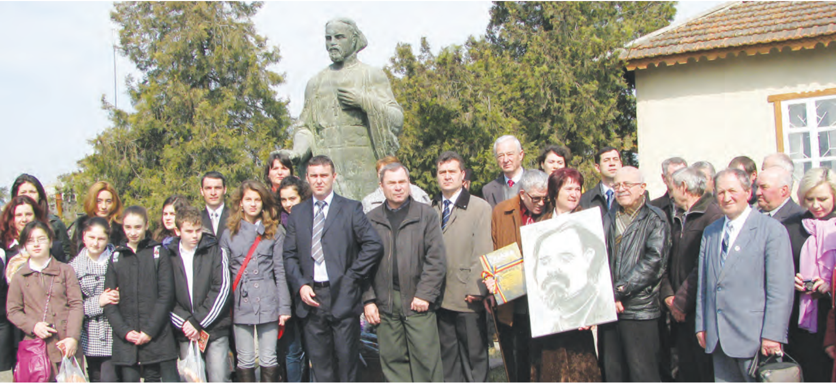
Zilele Naționale „Alexei Mateevici“, ed. a XXII-a, or. Căinari