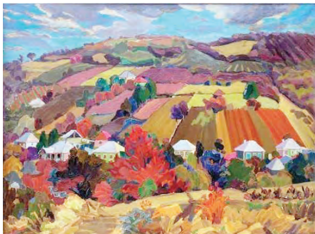
Eleonora Romanescu. Seara pe deal . 1967, ulei pe pânză.