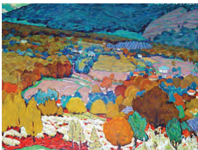
Eleonora Romanescu. Plai natal . 1969, ulei pe pânză.