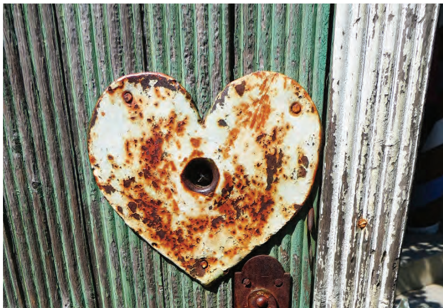
O particularitate a porților din satul Brânza o constituie utilizarea în decorație a motivului Inimii. Foto: IVX, 1 iunie 2019

La Brânza s-au născut inginerul Ion Bostan, membru titular (1995) al Academiei de Științe a Moldovei, și matematicianul Nicolae Vulpe, membru corespondent al Academiei de Științe a Moldovei (2012). În semn de înaltă apreciere pentru pământeanul lor celebru, sătenii au numit Liceul Teoretic din localitate în onoarea academicianului Ion Bostan. Aici învață circa 300 de copii. La 1 iunie 2019, la Liceul Teoretic „Academician Ion Bostan” a fost inaugurat, în premieră, în Republica Moldova, un Observator Astronomic-Planetariu, inițiativa aparținând academicianului Ion Bostan,