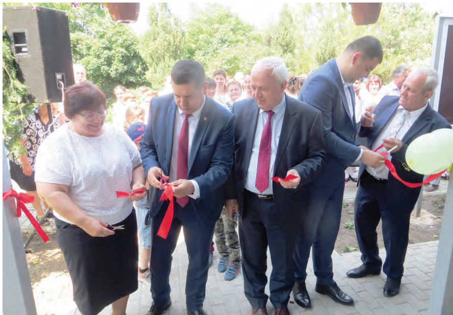
Inaugurarea Observatorului Astronomic-Planetariu la L.T. „Academician Ion Bostan”, s. Brânza. Foto: IVX, 1 iunie 2019

9. Localitatea este atestată documentar în 1630. Potrivit unor surse, în spațiul respectiv, până la 1630 a existat un sat mare, care a avut șapte biserici, ale căror temelii erau cunoscute în sec. al XIX-lea. Primele informații despre biserica din lemn din localitate datează din anul 1793. Icoanele pentru lăcașul sfânt au fost aduse din Transilvania și Muntenia. În datele recensământului populației din 1774 se menționează că în Brânza erau vornic Bostan, preot — Vulpe, dascăl — Andronic și patru birnici. În anii 1770—1780 în localitate s-au construit cinci mori de vânt, iar la sfârșitul secolului — încă trei. În 1827, comunitatea rurală era formată din 45 de familii de țărani români și 16 familii de ruteni românizați. La începutul sec. XX, țărani dețineau