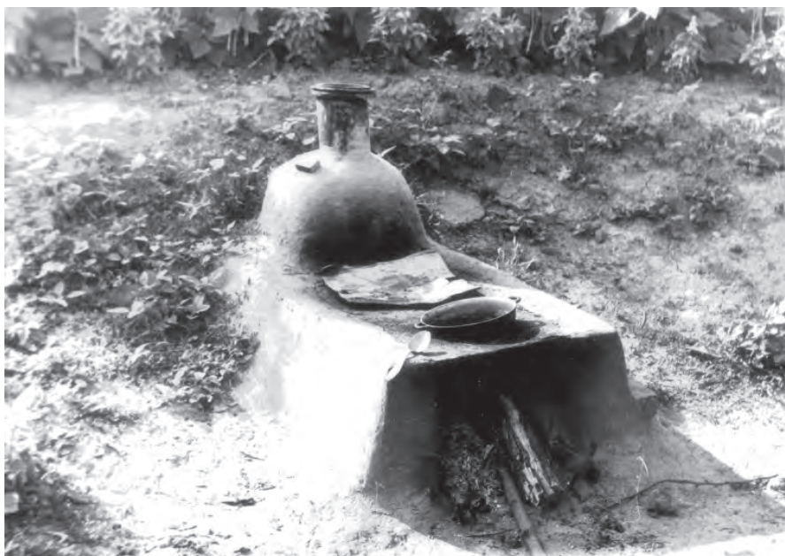
Cotlon, s. Brânza, 1983.

— 2 407 056 lei; în anul 2016 s-au realizat venituri de 2821445 lei și cheltuieli de 2 254790 lei, în 2017, respectiv, 1 881 738 lei și 1 757 520 lei. Creșa-grădiniță „Bucuria” are cinci grupe de copii. În 2015 s-au efectuat lucrări de reparație în sumă de 2 000 000 lei. Viața spirituală în comunitate este întreținută la trei edificii de cult: Biserica cu hramul Sf. Arhangheli Mihail și Gavriil , o Casă de Rugăciuni Evanghelică Baptistă și o Casă de Rugăciuni a Adventiștilor de Ziua a Șaptea. Biserica cu hramul Sf. Arhangheli Mihail și Gavriil a fost zidită din cărămidă în 1915, fiind edificată de enoriași, îndemnați de preotul Ignatie Macrițchi (a fost paroh, cu intermitențe, pe parcursul anilor 1904—1927) și starostele (epitropul) bisericii Ioan Antohi. Lăcașul sfânt are o arhitectură specifică perioadei țariste. Activitatea culturală a localității este menținută de Liceul Teoretic „Academician Ion Bostan”, Casa de Cultură, Biblioteca Publică etc. În 2013, în localul grădiniței s-a deschis Muzeul Satului „Casa Mare”. Acest spațiu al memoriei include o colecție de lucrări meșteșugărești și obiecte naționale și ale portului popular, diverse obiecte de uz casnic, adunate de la bătrânii satului. În sat mai funcționează Oficiul Poștal, stația de telefoane. În vara anului 2019, la Oficiul Medicilor de Familie lucrau un medic și șase surori medicale.