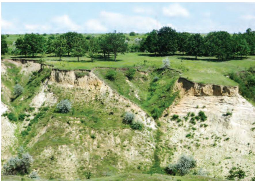
Urmare a extracției materialelor de construcție utilizat la edificarea căii ferate s-a creat o carieră imensă ne recultivată care provoacă numeroase alunecări de teren.

7. Referindu-ne la legenda localității, constatăm că denumirea este în concordanță cu etimologia localității, toponimia și ocupațiile tradiționale ale localnicilor. Se afirmă că în satul actual au venit familiile de ciobani cu oi și s-au așezat cu traiul în zona înconjurată de dealuri și păduri, în apropierea resurselor de apă. Au făcut o brânzărie mare. Nu toate ovinele erau ale acelor ciobani, ci și ale altor oameni care le-au dat în îngrijire. Pentru a-și ridica produsele erau nevoiți să se deplaseze de la o distanță considerabilă „la Brânza”. Unii dintre gospodari au îndrăgit locul și au decis să rămână definitiv cu traiul. Drept urmare a acestei amplasări s-a format și satul. Se consideră că localitatea a fost întemeiată de păstorii transilvăneni (mocani) în secolele XVII- XVIII. Numele de familie al fondatorilor localității sunt