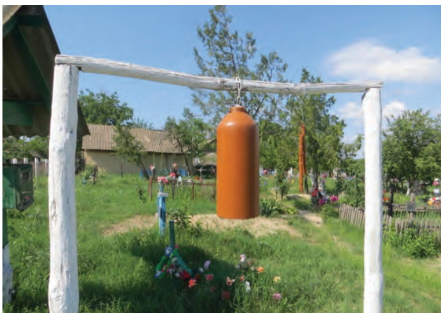
Clopot instalat la intrarea în cimitirul actual al satului. Foto: IVX, 1 iunie 2019

Neogene, atunci când Marea Sarmatiană acoperea întregul teritoriu. O caracteristică esențială a zonei este fragmentarea reliefului în numeroase văi, vâlcele, ravene rezultate din acțiunile cursurilor de apă (pâraie). Densitatea fragmentării reliefului o constituie 2-2,5 km 2 , iar adâncimea fragmentării reliefului este de 50-100 m. Procesele exogene contemporane sunt puternice, afectarea teritoriului de ravene este de 0,1-0,5 km 2 . O segmentare mai densă a reliefului se constată în partea de est a localității. În acest perimetru geografic se află râpile Tranche, Zăvoiu,