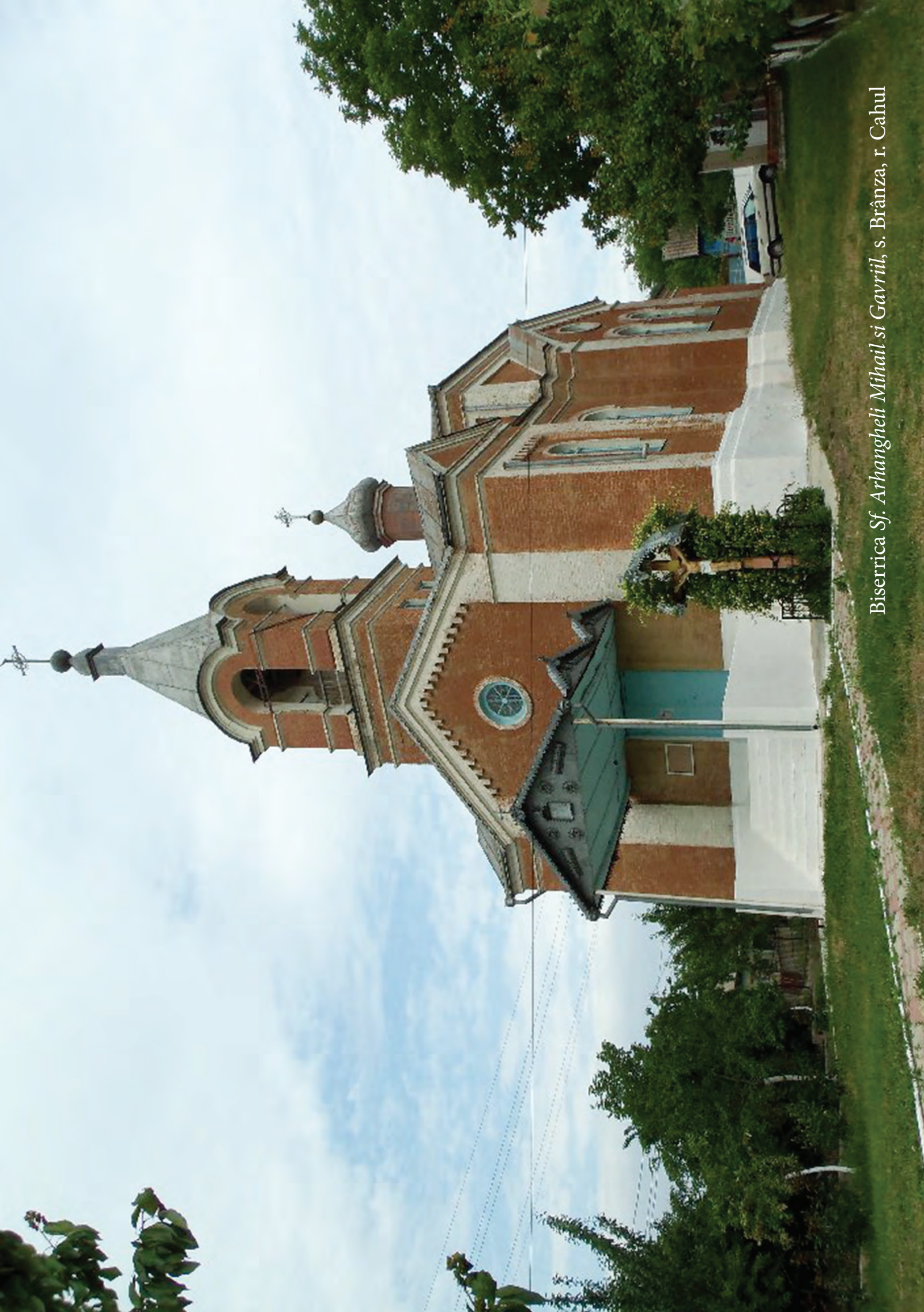
Biserica Sf. Arhangheli Mihail si Gavriil, s. Brânza, r. Cahul